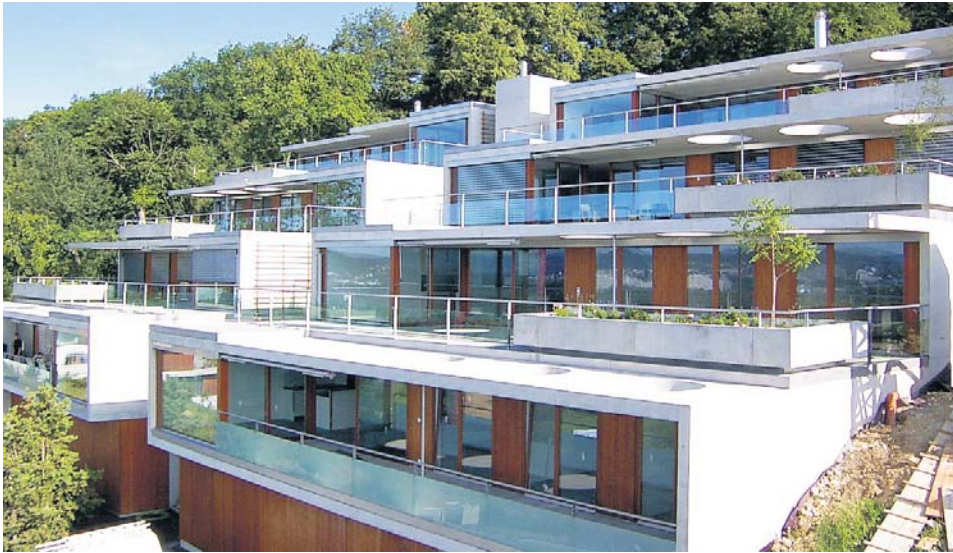
Terrassenhausüberbauung «Höhenweg», Biberstein – gebaut 2002/2003