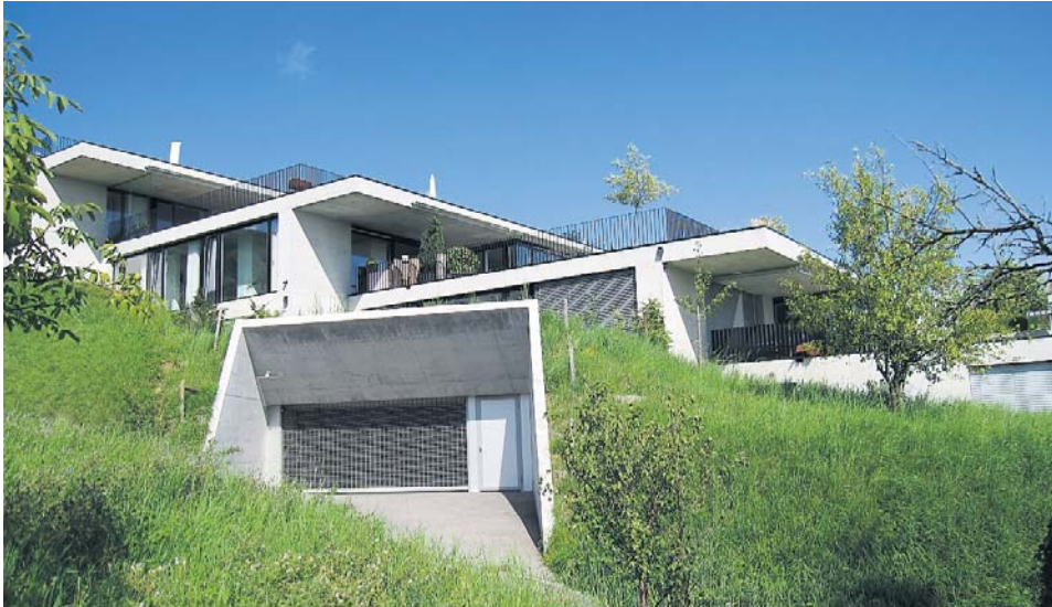
Terrassenhausüberbauung «Gislifluhweg», Biberstein – 2007