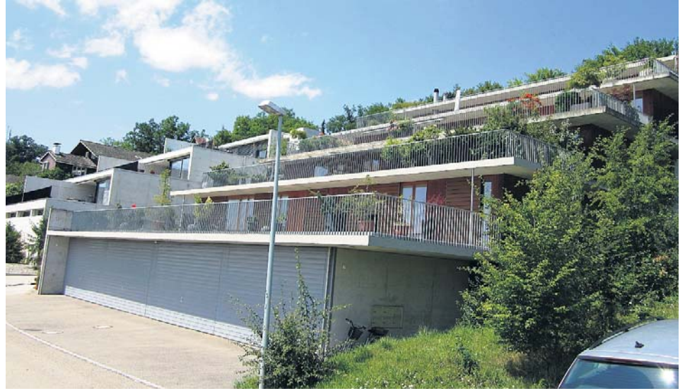
Terrassenhausüberbauung «Höhenweg Süd», Biberstein – gebaut 2000