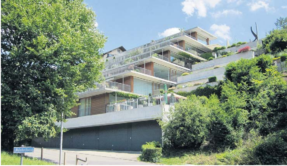
Terrassenhausüberbauung «uf de Platte», Biberstein – gebaut 1998