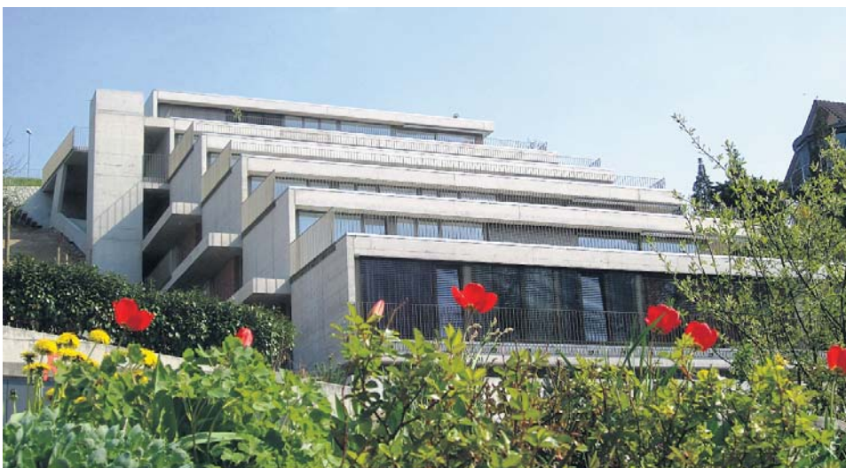
Terrassenhausüberbauung «Plattenrain», Biberstein – 2009