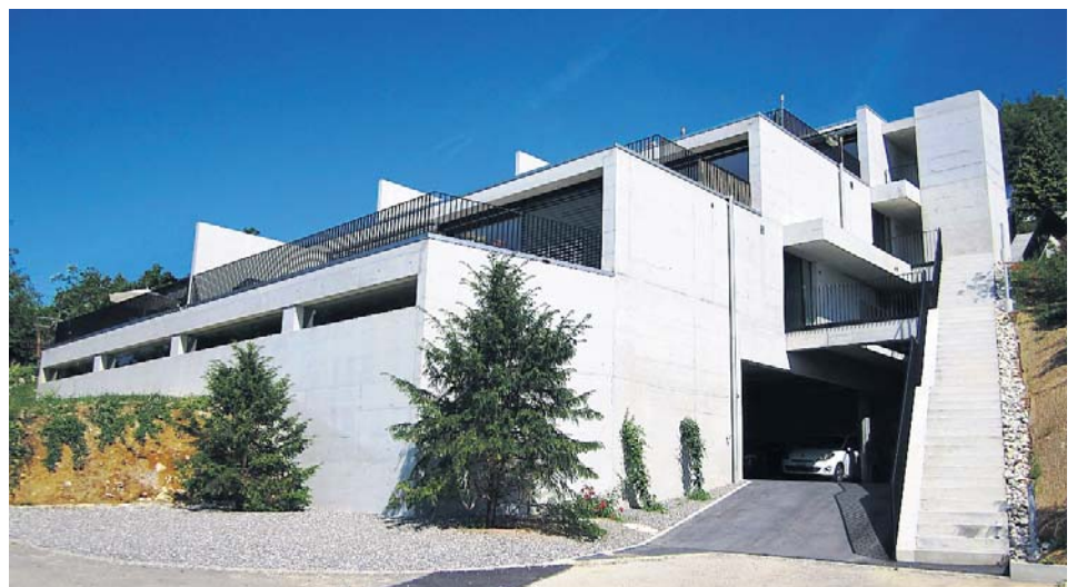
Terrassenhausüberbauung «Höhenweg», Biberstein – 2010