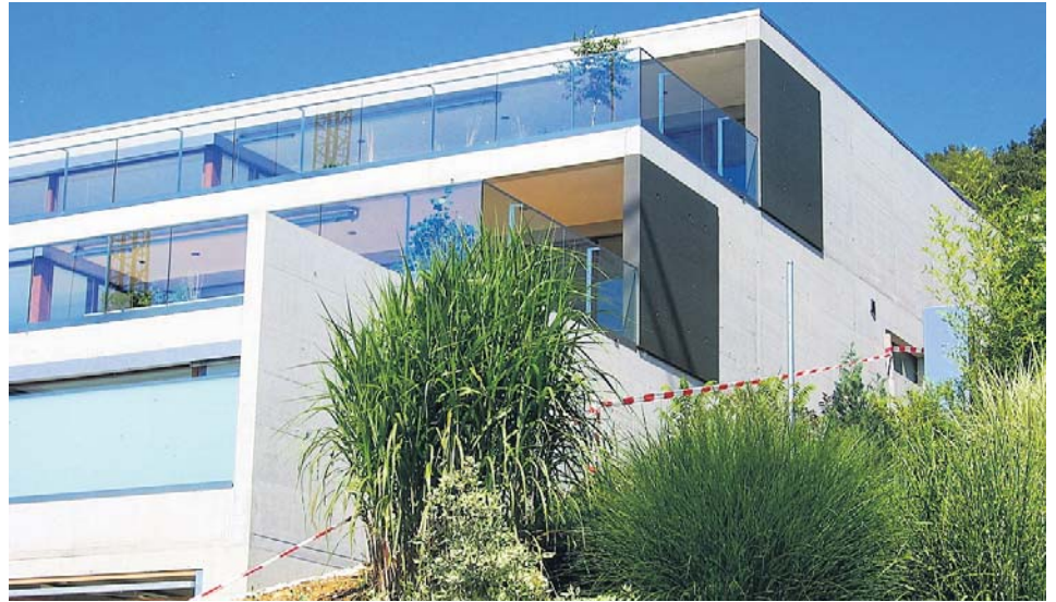
Terrassenhausüberbauung «Vidiella» Biberstein – gebaut 2006